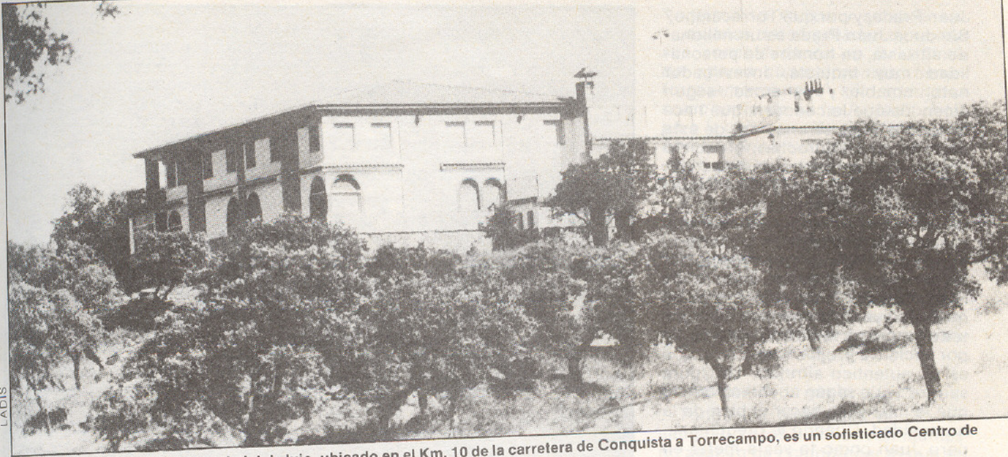
Lo que parece una mansión o chalet de lujo, ubicado en el Km. 10 de la carretera de Conquista a Torrecampo, es un sofisticado Centro de Investigaciones Científicas, con alta tecnología en materia de energía.