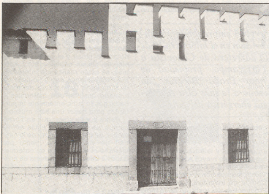
Esta es la casa-laboratorio donde se destilan sustancias medicinales y curativas para terapias, producidas de las plantas de los invernaderos cultivadas en Torrecampo. La casa está en pleno pueblo de Torrecampo, en la calle Reina Sofía.

E L descubrimiento más revolucionario hasta el momento es un "convertidor" de corriente continua en alterna, a partir de paneles de silicio amorfo, mezclado con energía eólica.