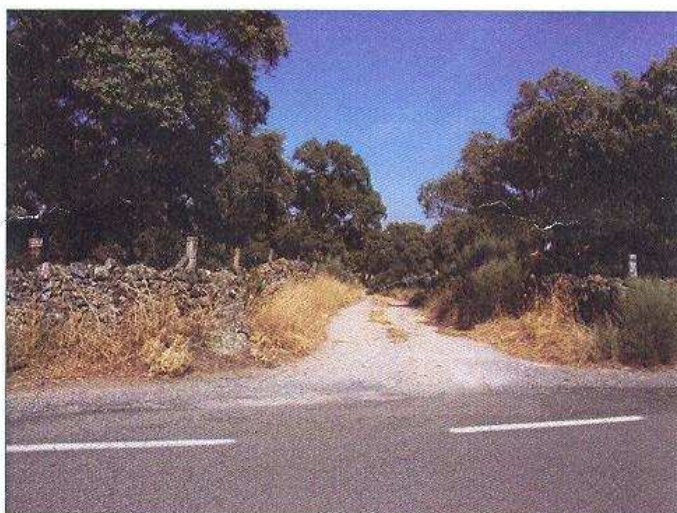
En la foto superior, inicio de la actuación en el pk 39 de la A-421. Abajo, fin de la actuación en la entrada a Villanueva.

Aunque la actuación acaba justo antes de la entrada a Villanueva de Córdoba, se va a llevar a cabo la rehabilitación estructural de la calle principal de entrada al municipio, ante el previsible deterioro que pueda sufrir durante la ejecución de las obras.